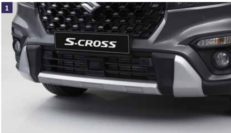
1 | Protecção Pára-choques Prateado, conjunto tres peças. Ref. 99115-63T00-K01