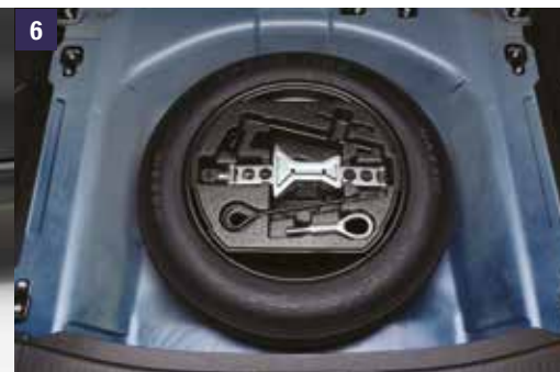
6 | Kit Roda Suplente Inclui pneu, válvula, jante, conjunto macaco e gancho. Ref. 990E0-STSVX-010