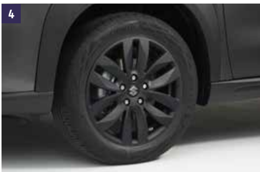
4 | Jante "MISTI" 6.5 J x 17" Adequadas para pneus 215/55R17, inclui tampa central com o logo S, certificado ECE-R 124. Preto Mate Ref. 990E0-61M76-002 Preto Polido Ref. 990E0-61M78-002