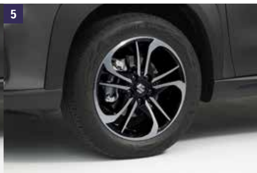
5 | Jante "MOJAVE" 6.5 J x 17" Preto polido, pneus 215/55R17, inclui tampa central com o logo S, certificado ECE-R 124. Ref. 43210-54PU0-0SP