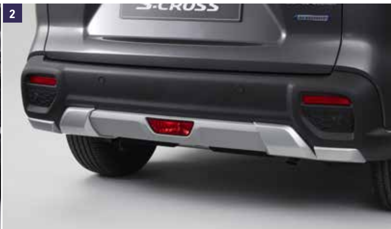
2 | Protecção Pára-choques Traseiro Prateado, conjunto quatro peças. Ref. 99115-63T10-K01