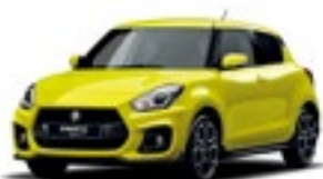
Champion Yellow (ZFT)