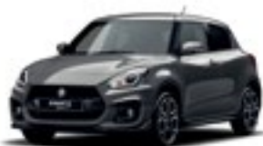
Cinza Mineral Metalizado (ZMW)