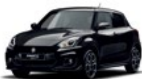
Preto Superior Pérola Metalizado (ZMV)