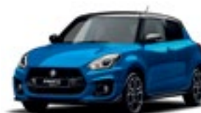
Azul Speedy Metalizado × Preto Pérola (C7R)