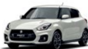
Branco Pérola Metalizado (ZVR)