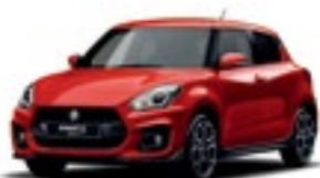
Vermelho Burning Pérola Metalizado (ZWP)