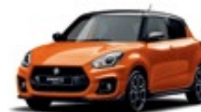
Laranja Flame Pérola Metalizado × Preto Pérola (CFK)