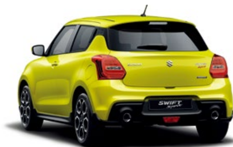
Champion Yellow (ZFT)