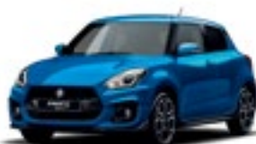
Azul Speedy Metalizado (ZWG)