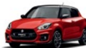
Vermelho Burning Pérola Metalizado × Preto Pérola (D7Z)