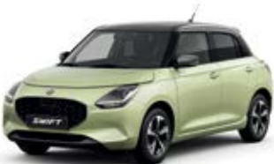
Amarelo Cool Metalizado / Cinza Mineral Metalizado