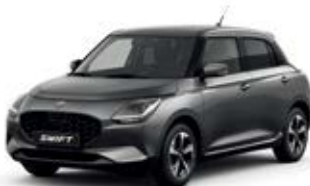
Cinza Mineral Metalizado