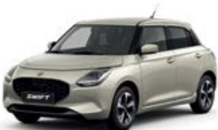
Marfim Pérola Metalizado