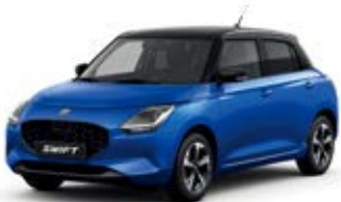
Azul Frontier Pérola Metalizado / Preto Superior Pérola Metalizado