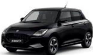
Preto Superior Pérola Metalizado