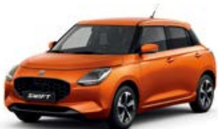
Laranja Flame Pérola Metalizado