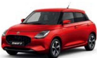
Vermelho Burning Pérola Metalizado