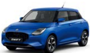
Azul Frontier Pérola Metalizado