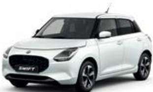
Branco Pérola Metalizado