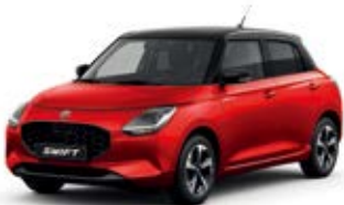
Vermelho Burning Pérola Metalizado / Preto Superior Pérola Metalizado