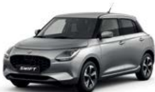
Prata Premium Metalizado