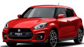
Vermelho Burning Pérola Metalizado (ZWP)