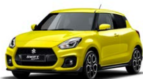
Champion Yellow (ZFT)