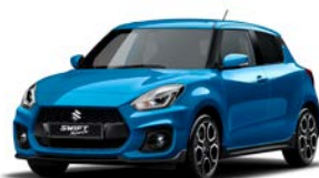
Azul Speedy Metalizado (ZWG)