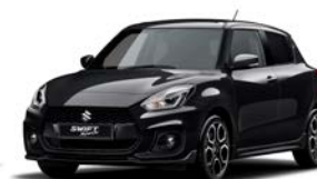
Preto Superior Pérola Metalizado (ZMV)