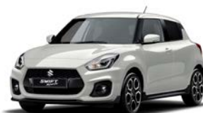
Branco Pérola Metalizado (ZVR)