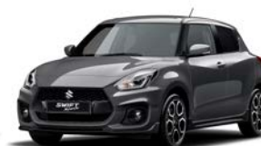
Cinza Mineral Metalizado (ZMW)