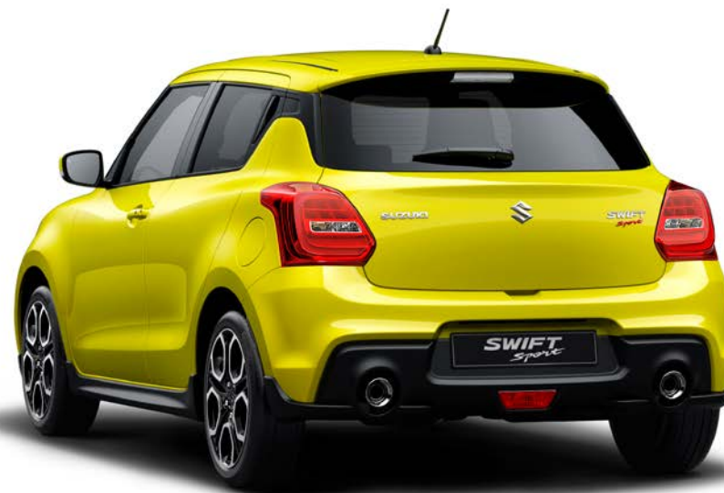
Champion Yellow (ZFT)