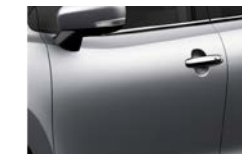
Prata Premium Metalizado (ZQS)