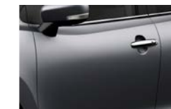
Cinza Brilhante Metalizado (Z2Z)