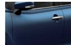
Azul Ray Premium Metalizado (Z9Q)