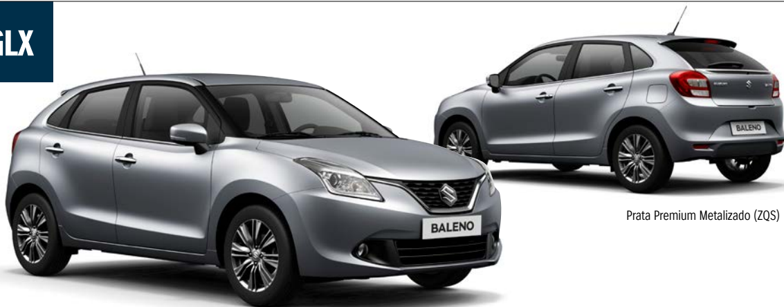
Prata Premium Metalizado (ZQS)