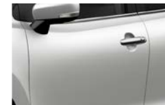
Branco Ártico Premium Metalizado (Z9H)