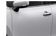
Branco Superior (26U)