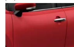
Vermelho Fire (Z4Q)