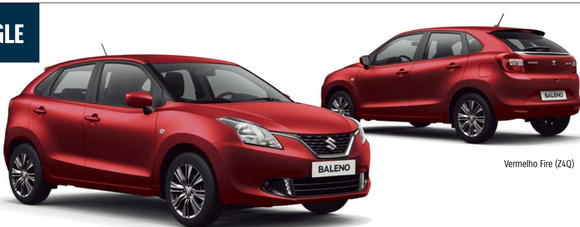
Vermelho Fire (Z4Q)