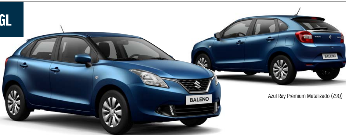
Azul Ray Premium Metalizado (Z9Q)