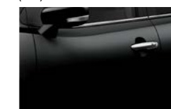
Preto Cósmico Pérola Metalizado (ZAM)