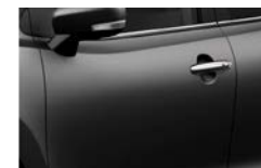
Cinza Granito Metalizado (Z2N)