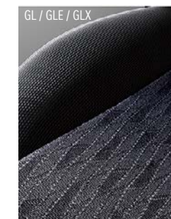
GL / GLE / GLX